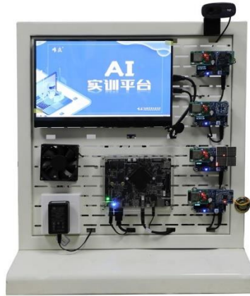
人工智能 AI 实训平台