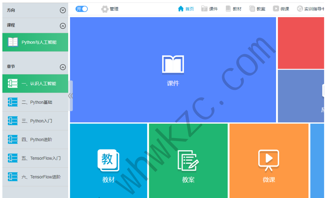
人工智能教学平台界面